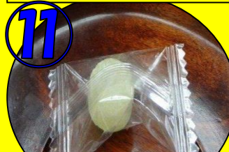
⑪ 栗キャンディー1個