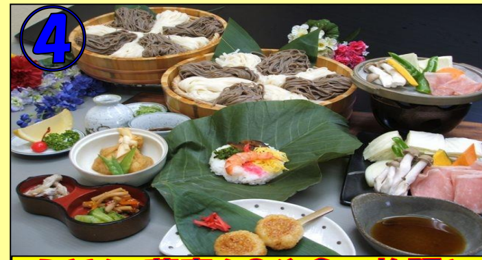
④ うどん・蕎麦60分食べ放題と 飛騨豚の陶板焼き 朴葉寿司・田舎の味芋こね餅付