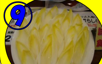
⑨ ちこり野菜のご賞味