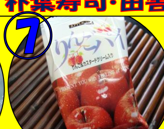
⑦ 信州りんごパイ1個