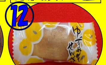
⑫ ゆず味噌せんべい1枚

各地＝恵那IC＝恵那川上屋《栗饅頭1個》＝山菜園①～⑦(3つフルーツ食べ放題は30分間)⑪⑫＝ 10:30 10:40～11:10 11:15～12:30 森林浴日本の100選付知峡散策⑩＝ちこり村《ちこり野菜ご賞味・野菜の種》⑨＝中津川IC＝各地 13:20～14:10 14:40～15:10 15:15