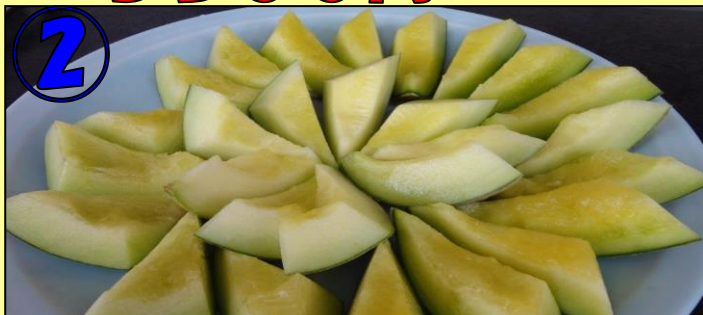
② メロン30分食べ放題