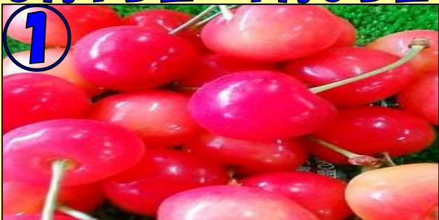
① さくらんぼ30分食べ放題