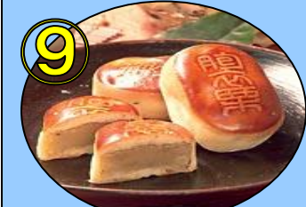
⑨ えな栗饅頭1個又は 栗きんとん1個