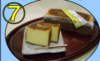
⑦ 元祖カスティ〜ラ御試食