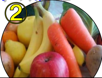
② 野菜+フルーツ1キロ