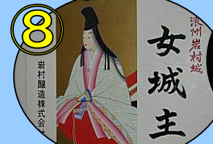
⑧ 酒蔵見学と銘酒試飲