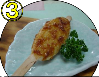
③ 郷土名物 五平餅1本