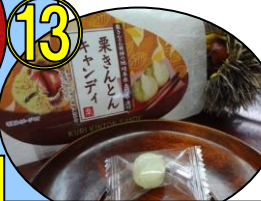
⑬ 栗キャンディー1個