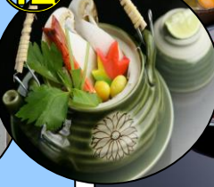
⑫ 松茸土瓶蒸しも 付けちゃいます