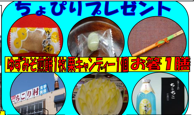
ちよぴりプレゼント ゆずみそ煎餅1枚栗キャンデー1個お箸1膳