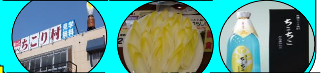
ちこい村野菜の種 ちこい野菜 ちこい焼酎試飲

コース 各地＝瑞浪IC10:00＝日本一の木造水車(おぼあちゃん市)10:20～10:45＝山菜園[飛騨豚の陶板焼きの昼食・3.9kgのお土産]11:30～12:40＝常盤座見学[別料金]13:05～13:40＝夕森公園散策 14:20～15:00＝ちこい村(ちこい焼酎試飲とちこい野菜ご賞味・野菜の種プレゼント)15:50～16:30＝中津川IC16:35＝各地