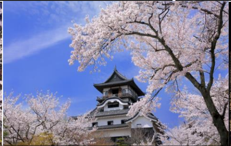
国宝・犬山城の桜 3月末～4月15日