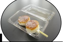
伊那路にて五平餅 (別100円NET)