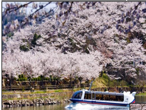
恵那峡さざなみの桜 4月3日～4月15日