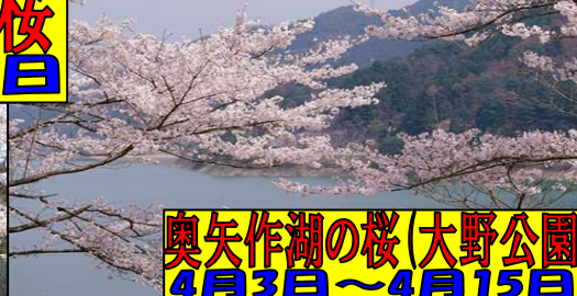
奥矢作湖の桜 (大野公園) 4月3日～4月15日