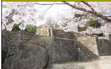
苗木城址の桜 4月3日～4月15日