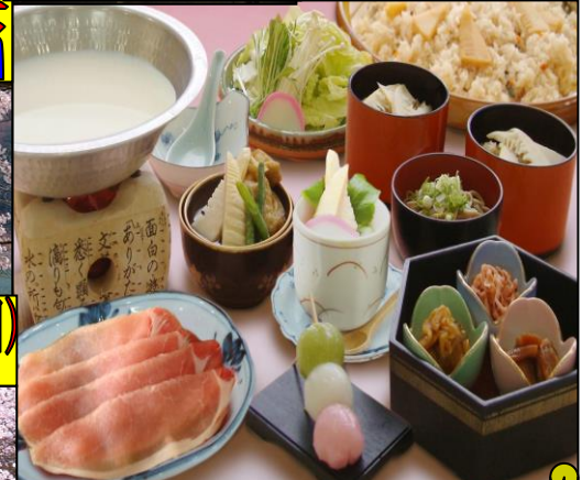
筍・山菜天ぷら・山菜ごはん食べ放題と 飛騨牛の豆乳鍋の昼食