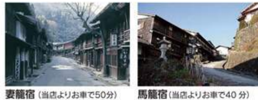
妻籠宿(当店よりお車で50分) 馬籠宿(当店よりお車で40分)