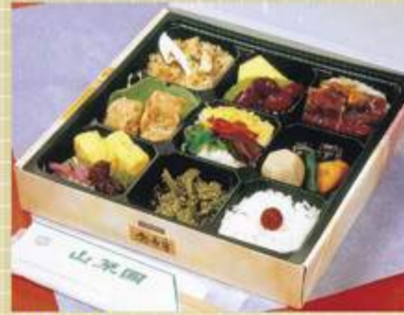
彩り弁当 1,200円 (税別)