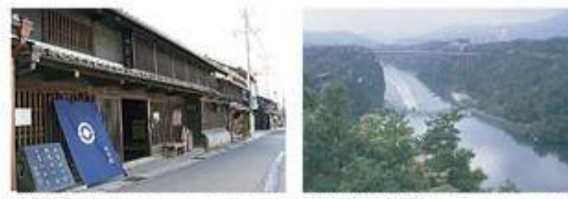
岩村城下町(当店よりお車で30分) 恵那峡展望台(当店よりお車で5分)