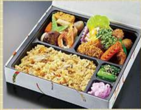
幕の内弁当 1,000円 (税別) (春は山菜ごはん、秋は松茸ごはん)